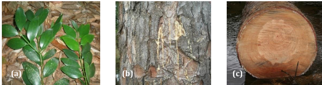
Gambar 1. Agathis (A. hamii) : daun (a), kulit batang (b) dan penampang melintang batang (c) Figure 1. Agathis (A. hamii) : leaf (a), bark (b) and cross section of stem (c)

lebar dan dinding sel serat tipis. Saluran damar sering ditemukan pada bidang lintang kayu. Saluran interselular radial dijumpai. Struktur makro dan mikro kayu agathis disajikan pada Gambar 2 dan 3.